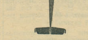
Тяжелый немецкий бомбардировщик Фокке-Вульф «Курьер». Вид сбоку, спереди и снизу.