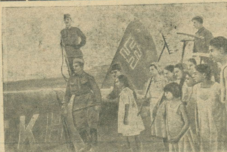
Фашистский самолет, сбитый отважными советскими летчиками.