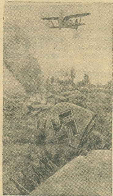
Славный советский сокол парит над сбитым им фашистским стервятником.

Бои по уничтожению немецких войск продолжались до трех дней, в результате которых 68 пехотная дивизия была полностью разгромлена.