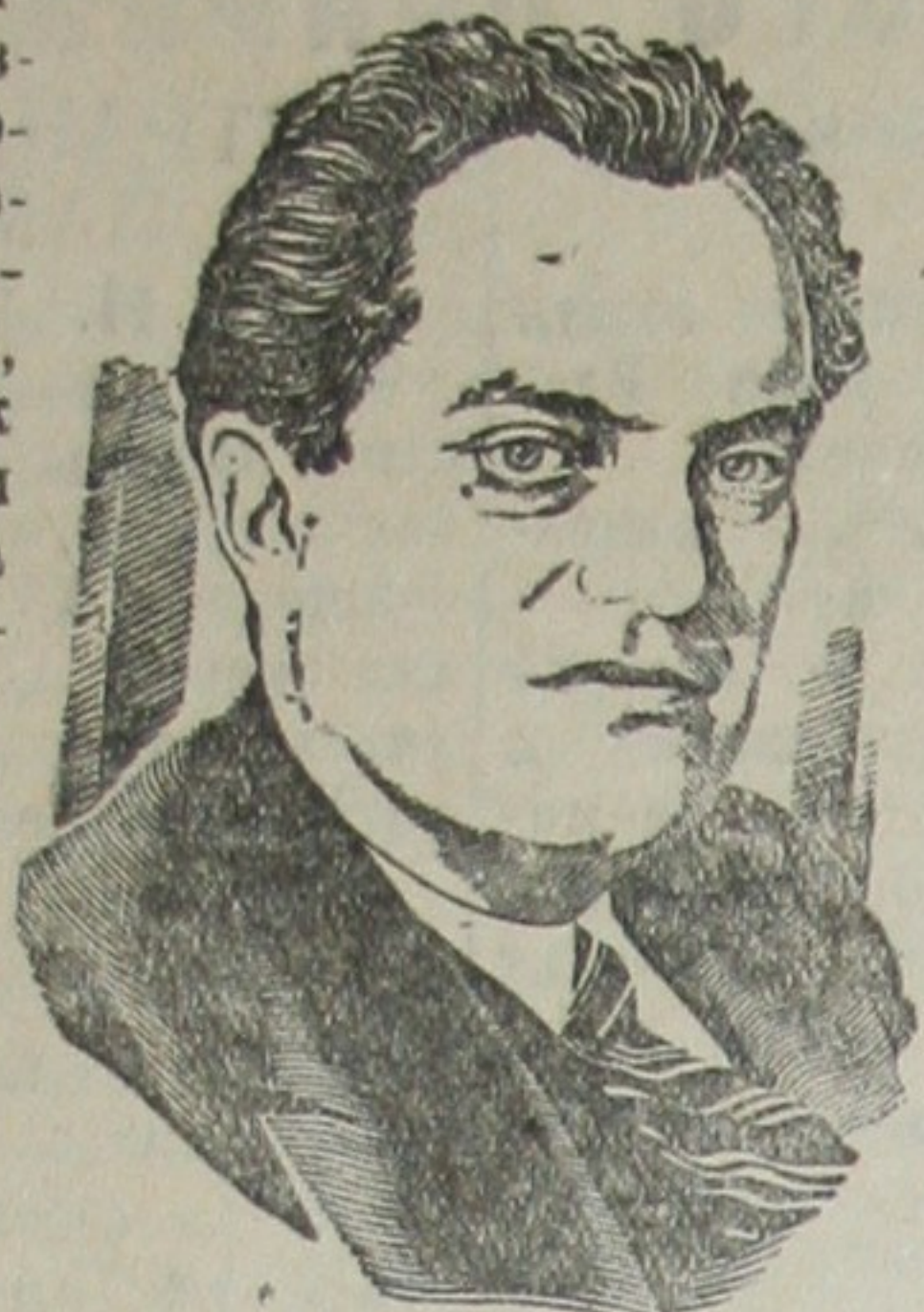
В. В. Куйбышев.

С юношеских лет начинается революционная деятельность В. В. Куйбышева. Шестнадцать лет в 1904 году он вступает в омскую организацию РСДРП и сразу примыкает к большевикам.