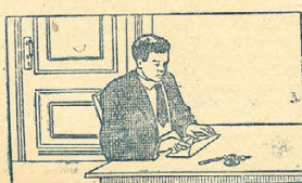
5 Избиратель владеет бюллетенем в конурт и заказывает конурт,