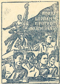
Плакат ИЗОГИЗ'а (художник В. Корейский).

Окружные избирательные комиссии получают протоколы и счетные листы от всех участковых комиссий и подсчитывают голоса, поданные за кандидатов по всему округу. Избранным будут считаться