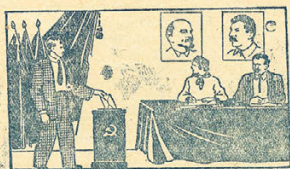
6 Избиратель переходит в конурт, где помещается участковая избирательная комиссия и опускает конурт в избирательный ящик.