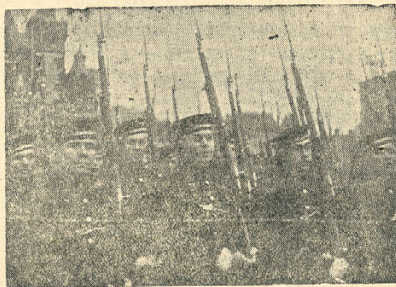
Парад части Рабоче-Крестьянской Армии на Красной площади в Москве.