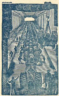
Граюра на дереве П. Старосова.

У нас не было тракторной промышленности. „У нас она есть теперь.“ (И. Сталин).