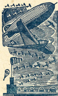
Гравюра на дереве П. Староносина.

«У нас не было авиационной промышленности. У нас она есть теперь». (И. Сталин).