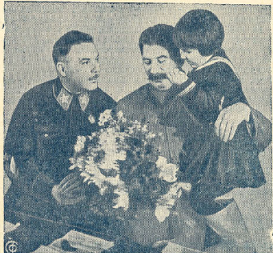
Тов. И. В. Сталин

Овладевая большевизмом, неуклонно повышая классовую бдительность, произывая всю работу огнем большевистской критики и самокритики, коллектив рабочих, ИТР и служащих под руководством партийных организаций должен выполнить обязательства, данные народу великому вождю и учителю тов. Сталину о выпуске первой продукции на год ранее установленного правительством срока.