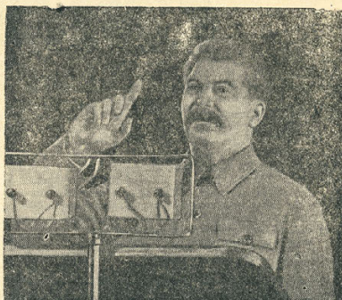
Выступление товарища И. В. Сталина на правительственном собрании избирателей Сталинского избирательного округа г. Москвы 11 декабря 1937 г. в Большом театре.

начальных и средних школах и вузах учится более 38 млн. человек. Только за 4 года второй пятилетки было построено в сельских местностях — 13,784 школы, в городах — 2,941. В СССР вышло учебных заведений — 700. В нашей стране осуществлено всеобщее обязательное обучение. Право на образование для всех граждан записано в Сталинской Конституции. Все народности