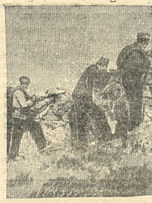
Бойцы пролетарских войск отражают атаку фашистских мятежников на Мадридском фронте.

тить часть территории близ деревни Ла Корунья и в районе Эль Паро, в которой они были выбиты. Вон прокатили также на участке Эсера и в районе Университетского городка. После длительного сражения мятежники отброшены.